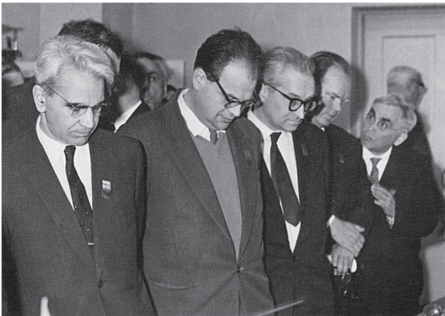
Посещение института (Киев, 1963 г.). На переднем плане слева направо: академики М.В. Келдыш, Н.Г. Басов, В.А. Котельников