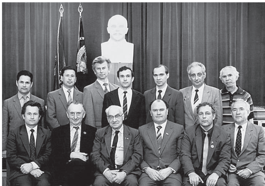
Посещение Производственного объединения «Электрон» (Казань, май 1985 г.). Сидят слева направо: 2 — А.М. Прохоров, 3 — В.А. Котельников, 5 — Ю.В. Гуляев