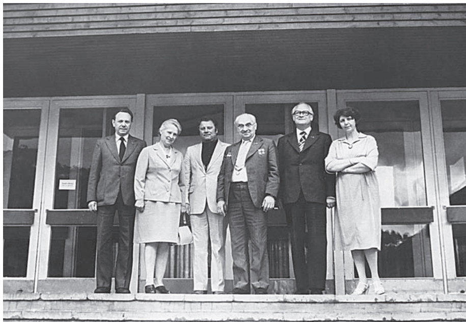
Таллин (10 июля 1980 г.). Справа налево: 2 — Президент АН ЭССР К. Ребане, 3 — В.А. Котельников, 5 — А.И. Богацкая-Котельникова