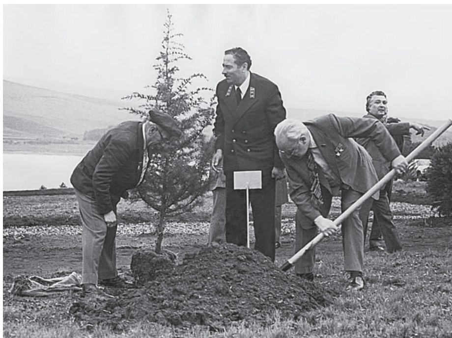
Посадка дерева дружбы (Грузия 1980 г.)