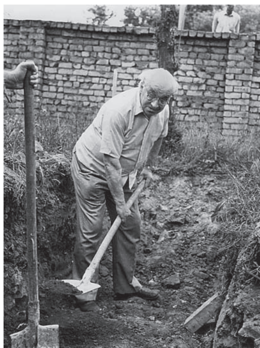
Закладка фундамента Инженерного центра Дагестанского филиала АН СССР (июнь 1988 г.)