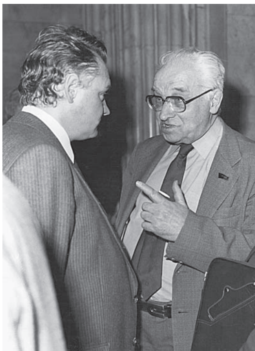
Как работает прибор (Ленинград)