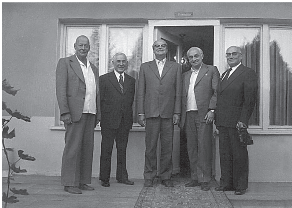
Армения (1977 г.). Слева направо: академики А.П. Александров, П.Н. Федосеев, Н.Г. Басов, В.А. Котельников